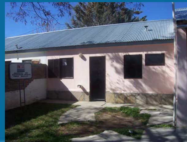
AER Chos Malal